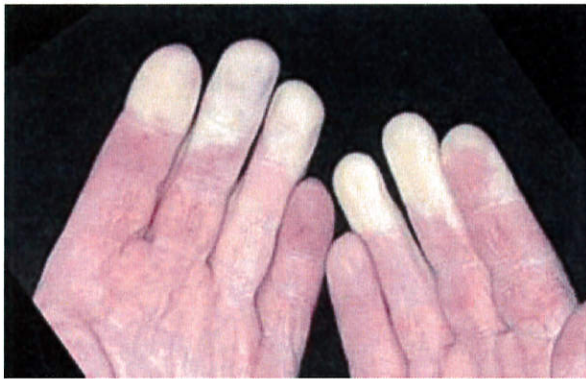
Exempel på "vita fingrar".

Tänk på att de flesta vibrerande maskiner även orsakar kraftigt buller. Risken för hörselskada är därmed uppenbar. Om du märker att du tillfälligt hör sämre eller att det susar eller ringer i öronen är det tecken på att du utsatt dig för skadliga ljudnivåer. Kortvariga men mycket höga ljud är direkt skadliga, till exempel smällar från slående maskiner.